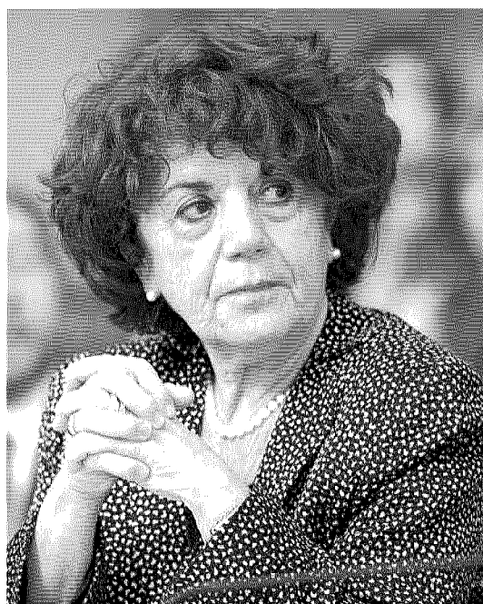
La ministra dell'Istruzione Valeria Fedeli

Cacciari sbaglia: non è vero che la scuola oggi punta solo al lavoro