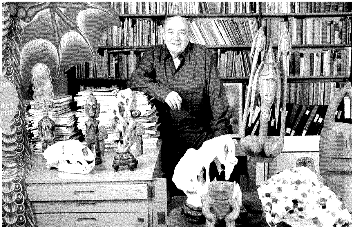
Lo scrittore nel suo studio di Oxford e i suoi oggetti preferiti

Parla Desmond Morris, grande zoologo e scrittore, che nei suoi saggi più celebri si sofferma sulle abitudini dell'uomo moderno: «Quando vedo i politici in tv tolgo l'audio: quello che dicono non è affidabile, il linguaggio del corpo dice tutto»