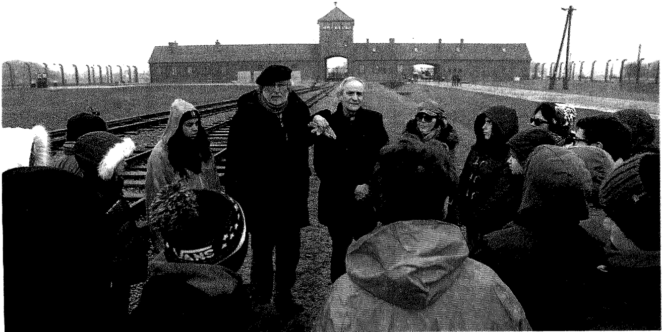
Storia e memoria. Francesco Guccini con il vescovo di Bologna Matteo Zuppi e i ragazzi della seconda media dell'Istituto Salvo d'Acquisto di Gaggio Montano (Bo)