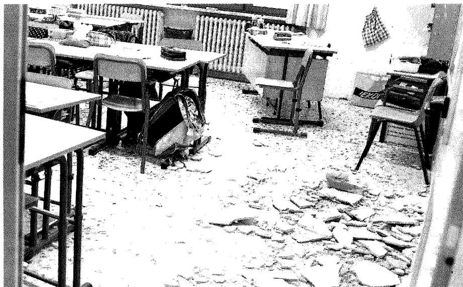
DETRITI Ecco come appare l'aula nel Torinese dove ieri si è sfiorata la tragedia

ALLA PICCOLA è stato diagnosticato un trauma cranico non commotivo, con una prognosi di 10 giorni. Comunque la scuola elementare oggi resterà chiusa, dichiarata «temporaneamente inagibile» per decisione proprio del sindaco. «Dobbiamo fare controlli anche nelle altre classi, la prudenza non è mai troppa – ha